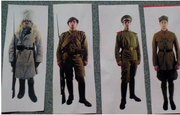
Obrázek 1: kartičky vojáků pro rozdělení do skupin.

Na druhé straně obrázku je jedna otázka (viz zadání úkolu), na kterou skupina v průběhu lekce najde odpověď.